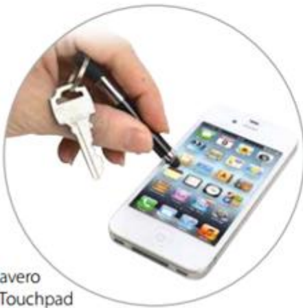
Llavero y Touchpad