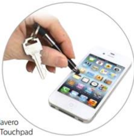
Llavero y Touchpad